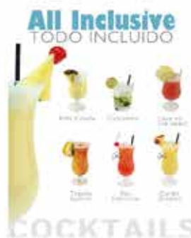
Cartas y Flyers